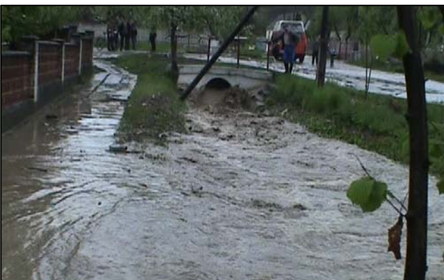
2. mája 2004 postihli našu obec záplavy